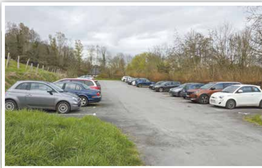
Parking Guillaume-de-Beaulieu, près de l'école maternelle.