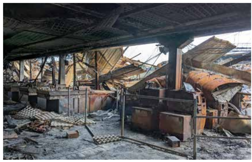
Les anciennes caisses du magasin de l'avenue Liabastre.

Totalement ravagé par un incendie dans la nuit du 31 décembre au 1 er janvier dernier, l'ancien supermarché de l'avenue Marcel-Liabastre a fini sa vie dans les flammes. 8000 m 2 de surfaces réduites en cendres, c'est le triste spectacle qu'il offre désormais aux quelques curieux qui s'aventurent à pied le long de la route. Alors que son successeur a ouvert ses portes le 14 février dernier (lire en page précédente), quid de cet ancien E.Leclerc, tant fréquenté par plusieurs générations de Honfleurais ?