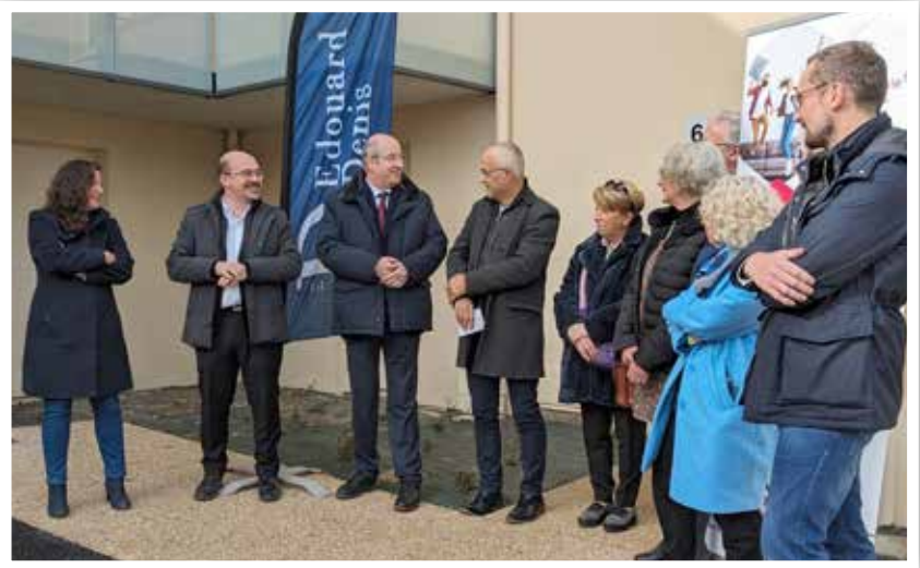
Les élus, bailleurs sociaux et promoteur immobilier ont visité les locaux en mars.

Loués par le bailleur social 3F Normandie, ces sept bâtiments (comprenant, au total, 1 studio, 16 T2,